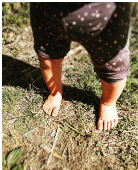
"PIEDS SALES =PIEDS HEUREUX"

Et voilà, vous avez trouvé la première clé du LACHER PRISE !!!!